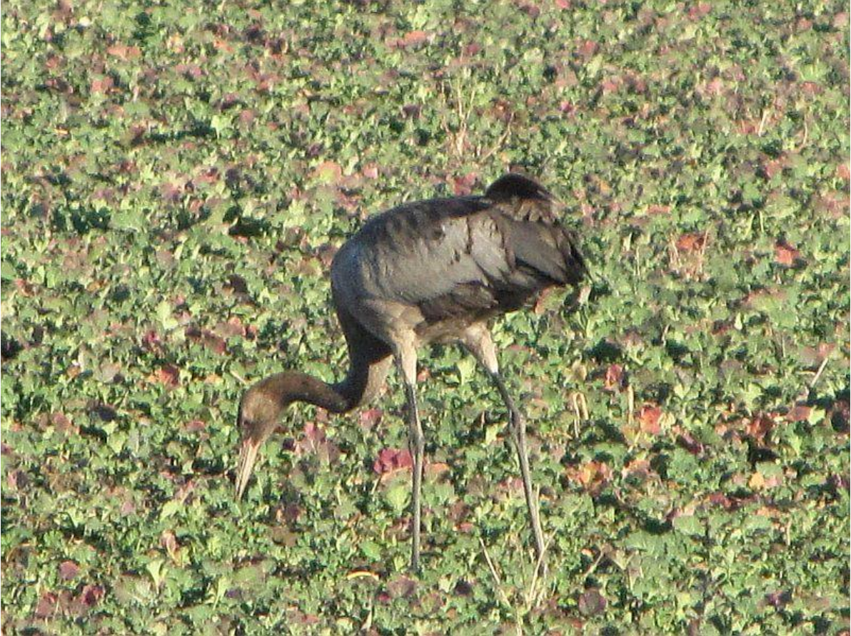
4. kép: A szigetvári daru