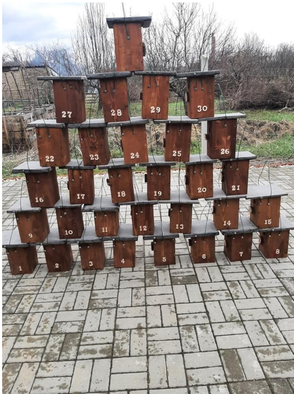
3. kép: Az odúk a kihelyezés előtt