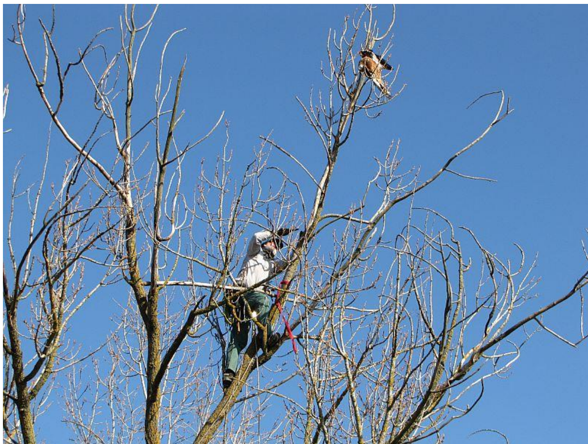
2. kép: A tetem megközelítése

A kiszáradófélben lévő fa állapota miatt a feladat nem volt veszélytelen, de a Duna-Dráva Nemzeti Park Igazgatóság természetvédelmi őrének segítségével sikerült lehozunk a madarat. A tetemet még aznap eljuttattuk a kányavédelmi program budapesti koordinátorához, aki gondoskodott annak bevizsgálásáról. Az eredményre valószínűleg még jó ideig várunk kell.