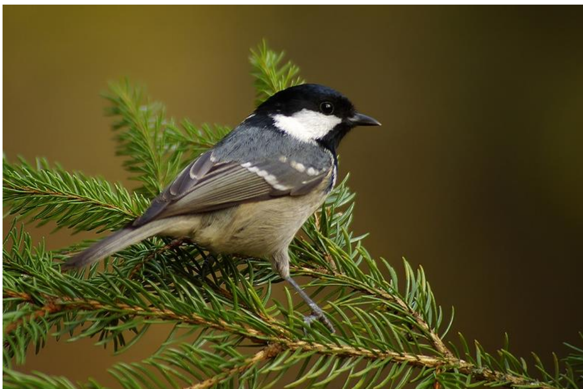
2. kép: Fenyvescinege két helyen is előfordult a vármegyében

Az összesített nemzetközi adatok alapján a legtöbb megfigyelési pont Magyarországon volt (161). A résztvevők számát tekintve a második (2445 fő), a látott madarak számát figyelembe véve pedig a negyedik helyen végeztünk (192.474 pld.).