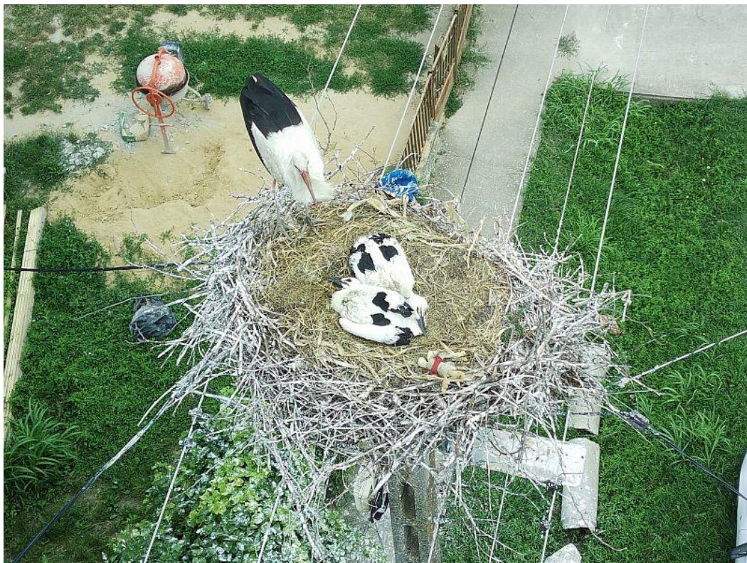
1. kép: Gólyafészkek felülnézetben

Várakozásainkban nem csalódtunk. A teljes megyére kiterjedő nyári felmérésünk során a faj 266 fészket vettük nyilvántartásba. Összesen 215 gólyapár fészekfoglalásának lehettünk tanúi, míg 4 fészket csak magányos gólyák laktak. Az állomány 20 párral nőtt a tavalyihoz képest, ami 10,3%-os gyarapodást jelent. A 47 lakatlan fészek kicsit soknak tűnik, de ezek közé számítjuk azokat a fészkeket is, amiket a fészekfoglaló párok építettek a költési időszak vége felé (játékfészkek). Arányuk meghaladja a 23%-ot.